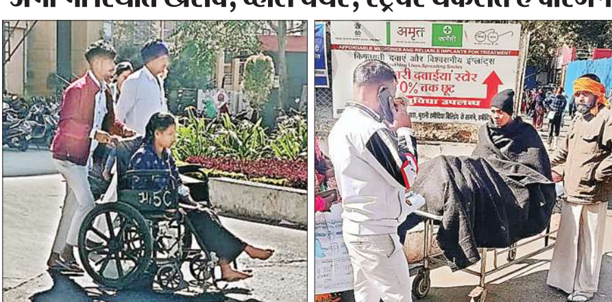
भोपाल। हमीदिया अस्पताल की यह तस्वीरें बता रही हैं कि अभी वार्ड बॉय कम पड़ते हैं, वार्ड बॉय हटाए जाने पर स्थिति बदलेगी।