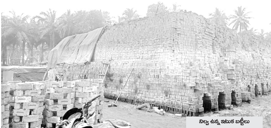
నిల్వ ఉన్న ఇటుక బట్టీలు

ప్రజాశక్తి - కాకినాడ ప్రతినిధి గత ప్రభుత్వంలో మార్గదర్శిత బిడివి కూటమి సర్కారులోనూ ఇసుక కష్టాలు తప్పడం లేదు. నెలల తరబడి ఇసుక సరఫరా అందుబాటులో లేక నిర్మాణాలు ఎక్కడిక్కడైతే నిలిచిపోయాయి. దీంతో, అమ్మకాలు పూర్తిగా పడిపోయి ఇటుక నిల్వలు పేరుకుపోయాయి.