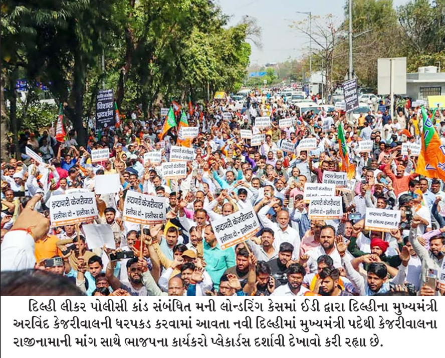
દિલ્હી લીકર પોલીસી કાંડ સંબંધિત મની લોન્ડરિંગ કેસમાં ઈડી દ્વારા દિલ્હીના મુખ્યમંત્રી અરવિંદ કેજરીવાલની ધરપકડ કરવામાં આવતા નવી દિલ્હીમાં મુખ્યમંત્રી પદેથી કેજરીવાલના રાજીનામાની માંગ સાથે ભાજપના કાર્યકરો પ્લેકાર્ડસ દર્શાવી દેખાવો કરી રહ્યા છે.

ન્યુયોર્કનાં ગુરૂદ્વારામાં અરવિંદ કેજરીવાલ તથા ખાલીસ્તાની શીખ નેતાઓ વચ્ચે બેઠક થઈ હતી અને તેમાં કેજરીવાલે દેવીદેવશાલિંધને મુક્ત કરવાનું વચન આપ્યું હતું. પન્નુએ જોકે અગાઉ પણ કેજરીવાલ તતા તેમની પાર્ટી આપ સામે ખાલીસ્તાની ગ્રુપ તરફથી ફંડ આપવાનો आरोप મુક્યો હતો. ગત જાન્યુઆરીમાં પણ પન્નુએ કહ્યું હતું કે કેજરીવાલ તથા પંજાબના મુખ્યમંત્રી ભગવંત માને અમેરિકા તથા કેનેડાનાં ખાલીસ્તાની સમર્થકો પાસેથી ૬ મીલીયન ડોલરનું દાન મેળવ્યું હતું. પન્નુએ અગાઉ કેજરીવાલ તથા માનને એવી ધમકી પણ આપી હતી કે કેલ્યુચારી સુધીમાં ખાલીસ્તાની નેતાઓને મુક્ત કરવામાં નહી આવે તો ગંભીર પરીણામો આવશે. પંજાબ પોલીસે જાગૃતીસિંધ, મનજીતસિંધ, તથા દેવીદેવશાલિંધની ધરપકડ કર્યા બાદ પન્નુએ આ ધમકી આપી હતી. અરવિંદ કેજરીવાલની શરાબ નીતી કૌભાંડમાં ઈડીએ ગત સપ્તાહે જ ધરપકડ કરી હતી અને હાલ તેઓ, ૨૮ મી સુધી ઈડીની કસ્ટડીમાં છે. શરાબ નીતીમાં કરોડોનો ભ્રષ્ટાચાર થયાનો आरोप મુકવામાં આવ્યો છે. કેજરીવાલની ધરપકડને પગલે પાર્ટી દ્વારા ત્રણેક દિવસથી વિરોધ પ્રદર્શન કરવામાં આવી રહ્યું છે. ઈડીએ એવો દાવો કર્યો હતો કે કૌભાંડના પુરાવાનો નાશ કરવા માટે ૧૭૦ ફોન નષ્ટ કરવામાં આવ્યા હતા. આમ આદમી પાર્ટી દ્વારા રાજકીય ઈશારે સમગ્ર કાર્યવાહી થયાનો आरोપ મુકવામાં આવ્યો છે. લોકસભાની ચૂંટણીમાં કેજરીવાલને પ્રચારથી દુર રાખવાનો आरोપ છે.