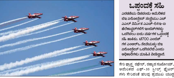
ನಿಮಿಷಗಳ ಕಾಲ ಎರಡು ಆಕಾಶದ ತನ್ನ ಶಕ್ತಿಯನ್ನು ಪ್ರದರ್ಶಿಸಿತು. ಹನ್ನೆರಡು ದಿನಗಳ ಯುದ್ಧ ವಿಮಾನಗಳ ಹಾರಾಟ ನಡೆಸಿದರು. ಎರಡು ದಿನಗಳ ಹಾರಾಟ ನಡೆಸಿದರು. ಎರಡು ದಿನಗಳ ಹಾರಾಟ ನಡೆಸಿದರು...