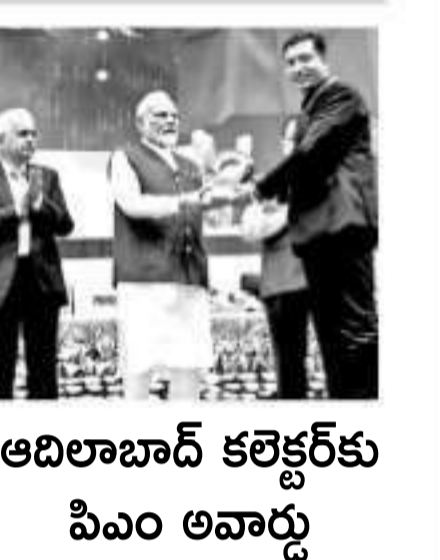
అదిలాబాద్ కలెక్టర్ కు పిం అనార్లు

పానిపోయాడంటూ సంబంధిత అధికారులను ప్రశ్నించారు. సైబర్ నేరస్థుడిని రాత్రి సమయంలో తనుతో ఎందుకు ఉండుకోవాల్సి వచ్చిందో వివరణ ఇవ్వాలంటూ ఆదేశాలు జారీ చేశారు. గతంలో కూడా ధిల్లీ, యూపీ, హర్యానాలో అరెస్టు చేసిన సైబర్ నేరస్థులను ధిల్లీలోని తెలంగాణ భవన్లో తమకు తెలియనివిన రూముల్లో పెట్టుకున్న సందర్భాలు అనేకం ఉన్నాయి.